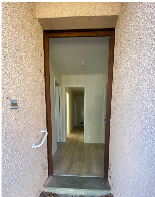
Entrée du logement