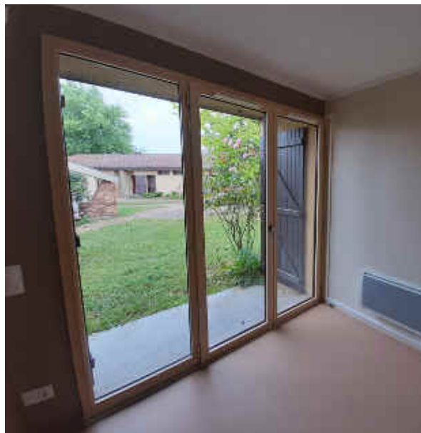
Pièce de vie