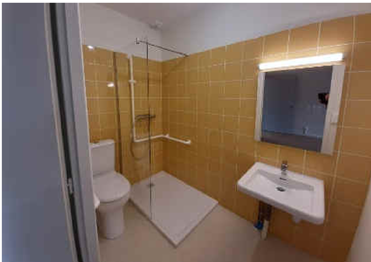
Salle d'eau - Toilettes

Les logements de la RA ont fait l'objet d'une rénovation en 2020 subventionnée en partie par la CARSAT.