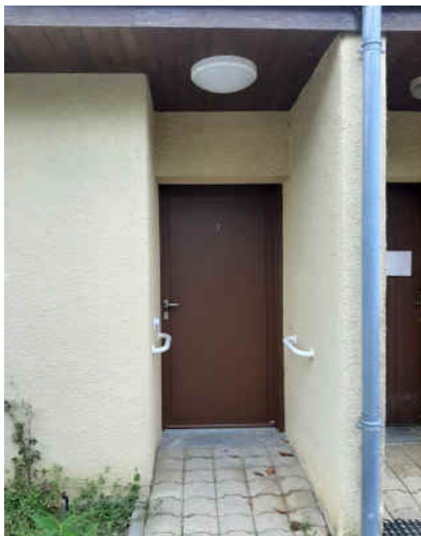
Entrée du logement

La grande pièce à vivre donne sur un petit jardinet que chacun pourra fleurir à sa guise.